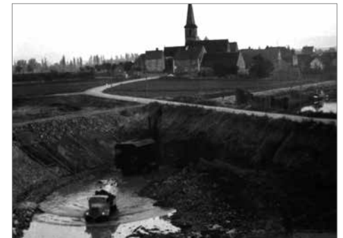
Bau des RMD 1950–1957