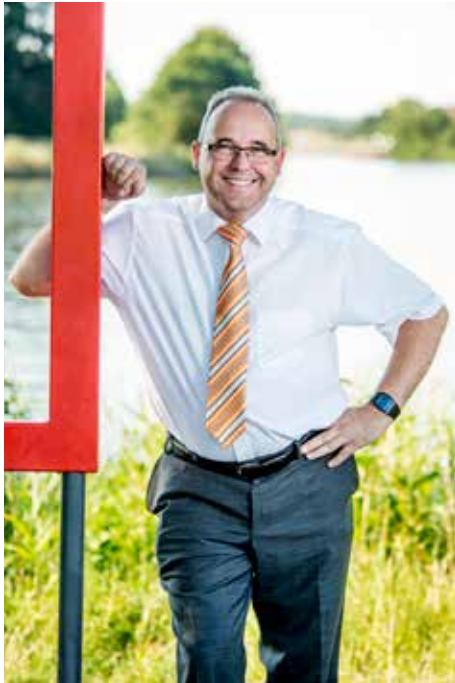
Volker Schmitt 1. Bürgermeister

Liebe Gäste, liebe Leserinnen und Leser,