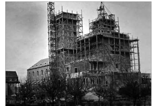
Bau der Klosterkirche 1935–1938